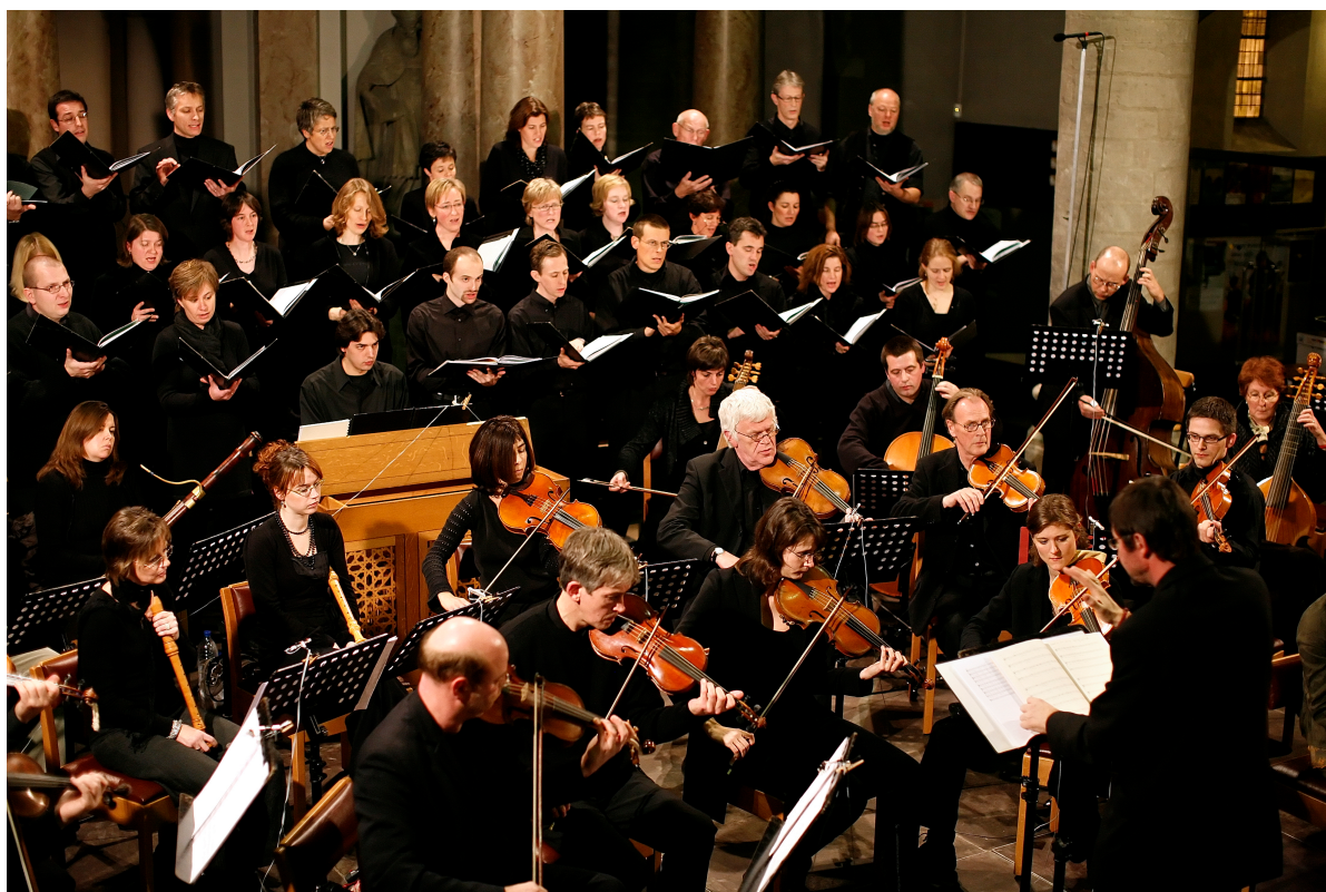
OrSeCante en het Bhag-ensemble in 2007